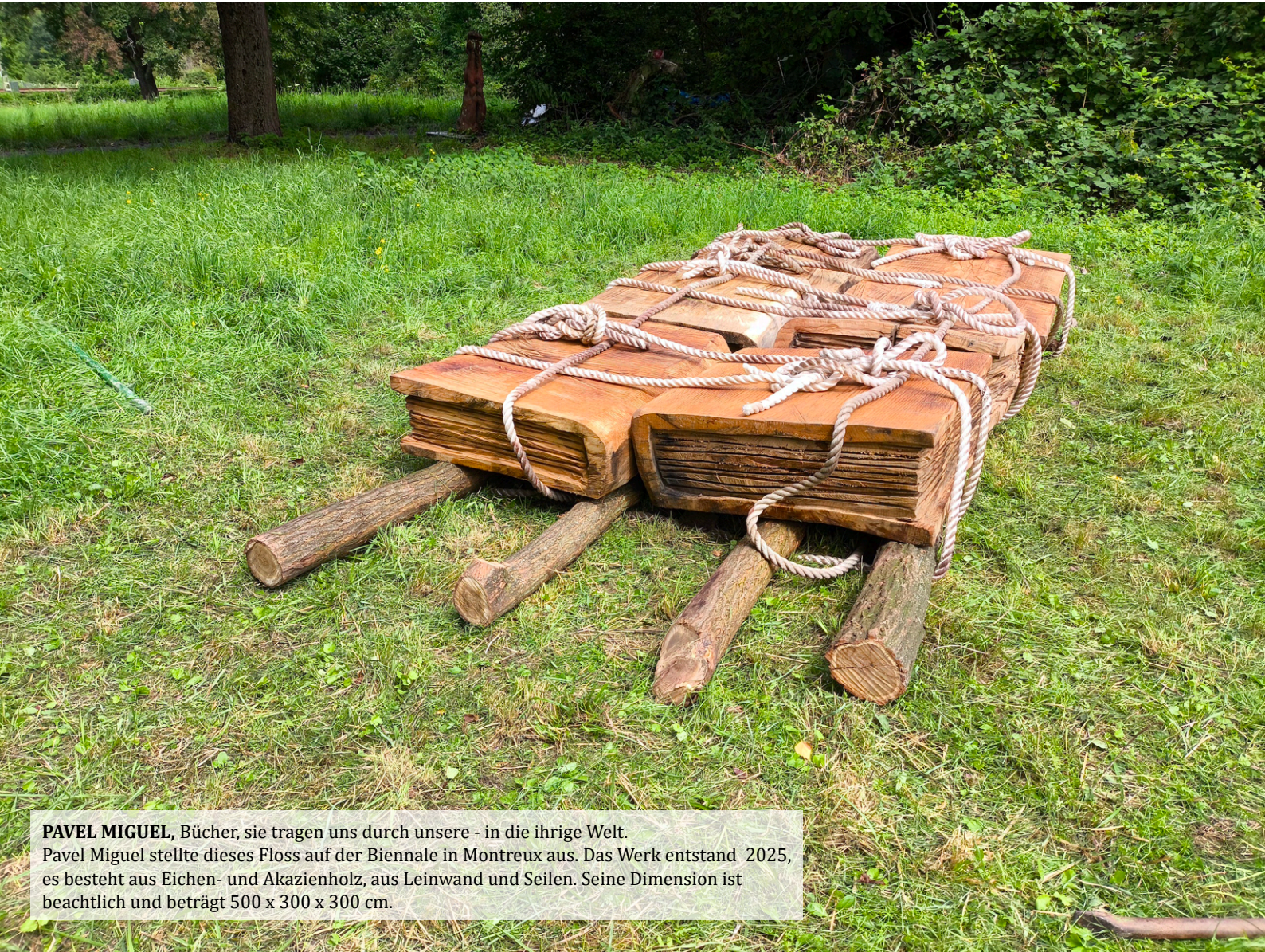
PAVEL MIGUEL , Bücher, sie tragen uns durch unsere - in die ihrige Welt. Pavel Miguel stellte dieses Floss auf der Biennale in Montreux aus. Das Werk entstand 2025, es besteht aus Eichen- und Akazienholz, aus Leinwand und Seilen. Seine Dimension ist beachtlich und beträgt 500 x 300 x 300 cm.