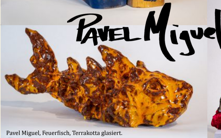
Pavel Miguel, Feuerfisch, Terrakotta glasiert.