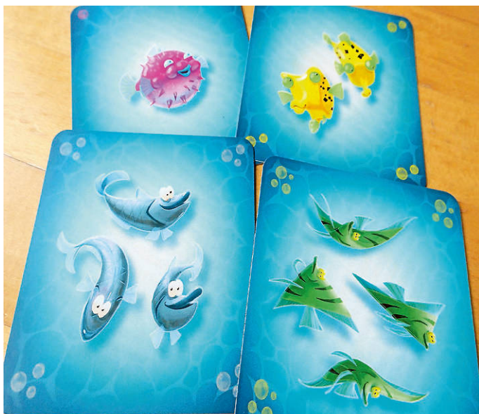
Wir haben unseren eigenen Satz von Fischkarten mit null bis vier Fischen.

Für Riskiotaucher*innen: „Zwai“, Karten-Legespiel um Fischeswärme und gefährliche Haie von Dirk Baumann, Illustration von Lars Besten, Piatnik, 2025, etwa 20 Minuten, zwei bis vier Personen ab acht Jahren, auszuleihen in der Stadtteilbibliothek Durlach